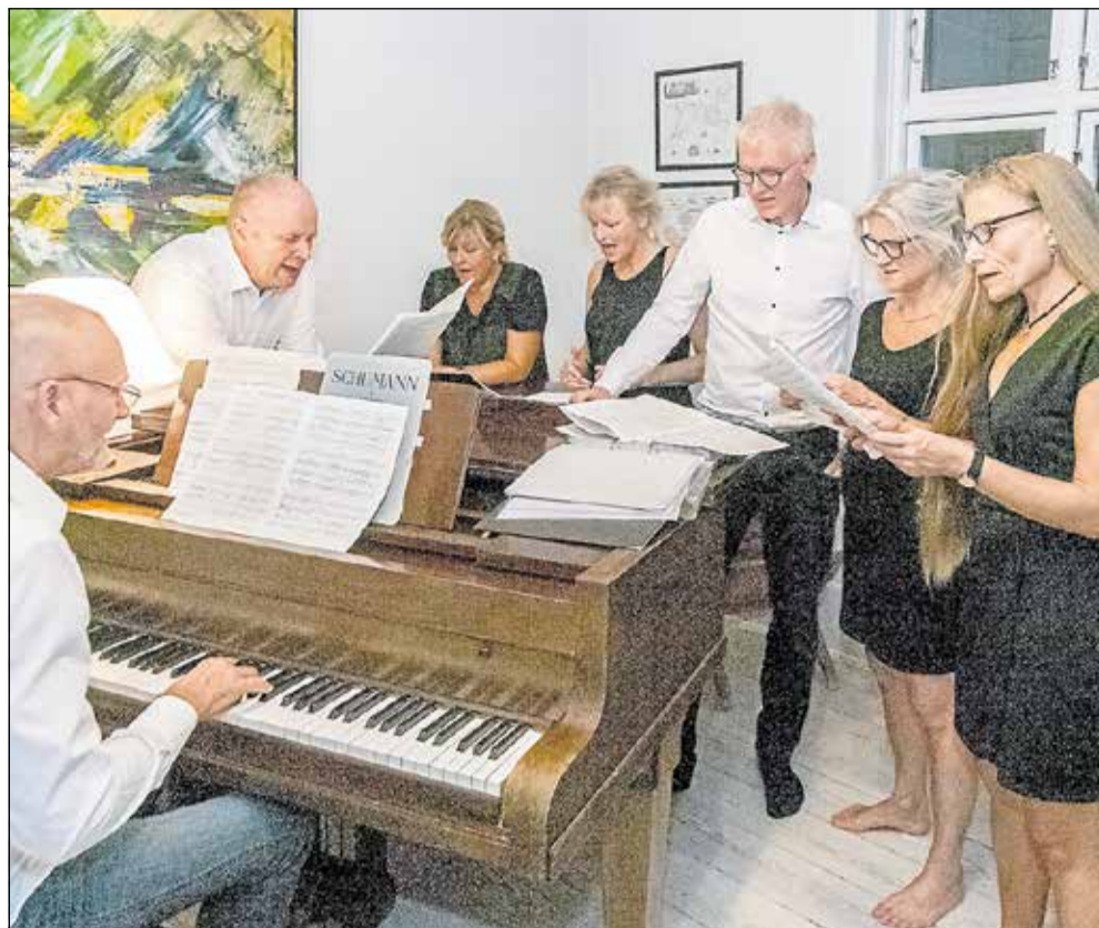
Real Moments er gået i skarp træning forud for koncerten i Holsted Kirke 1. februar.

stk. - Danmarks bedste, hvis vi skal tro vores lydmand.