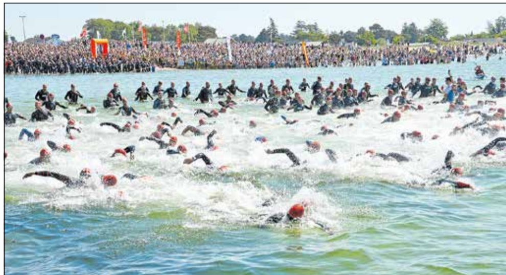
Det er vildt og fascinerende at se triatleter i aktion. Karrebæksminde Triatlon trækker stadig flere deltagere og ikke mindst publikummer. HGATM har infomøde for begyndere onsdag 7. februar.