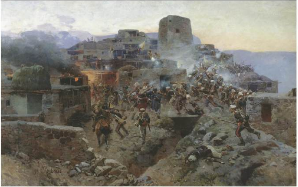
Russisk angreb på Ghimei. Dette billede kan muligvis illustrere angrebet på Gergabil