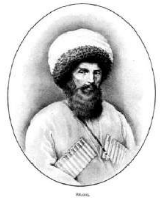
Imam Shamil (1799 - 1871)