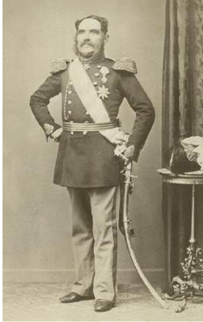
General G. D. Gerlach (1797 – 1865)

bedt om tilladelse til evakuering af Dybbøl skanserne om nødvendigt. Ministeren havde for så vidt givet general Gerlach frie hænder, men havde nogen timer senere sendt en depeche, som klart sagde, at Dybbølskanserne skulle forsvares til det yderste, indtil forhandlingerne i London var kommet i gang. Ministeren havde fået en klar ordre fra Premierminister Monrad.