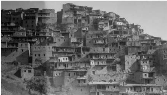
Foto af Gergabil fra 1920 30'erne fra W. O. Fields billedsamling, A. G. S. Library