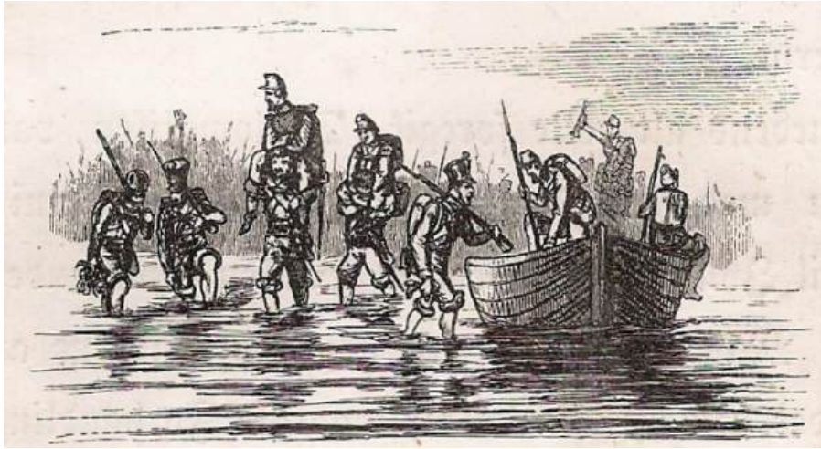
Landgangen ved Hjelsminde