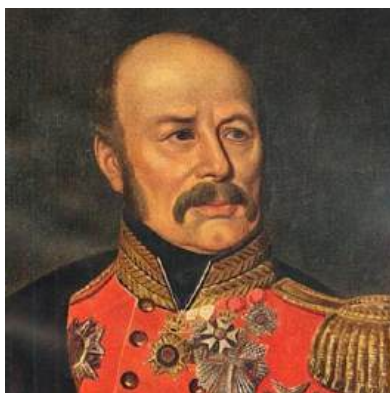
Generalguvernør von Scholten