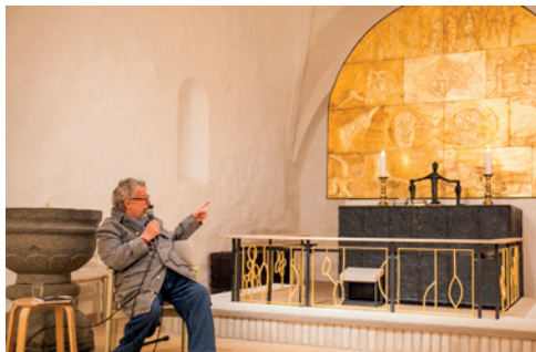
Altartavlens skaber, Peter Brandes