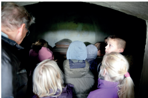
Minikonfirmander ved Volles grav