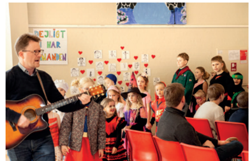
Snart er det igen tid for fastelavn