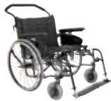
Legend 2 XL (max 160 kg)