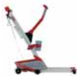
Quick Raiser 2+ (max 200 kg)