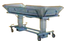
Mobilt brusebadeleje (max 400 kg)