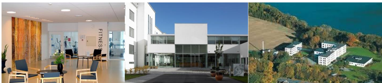
Weekend-opholdene foregår på træningscenter Sano i Skælskør

Vælg vores weekend-ophold, med efterfølgende rådgivnings samtaler i 6 uger. Se www.adicare.dk