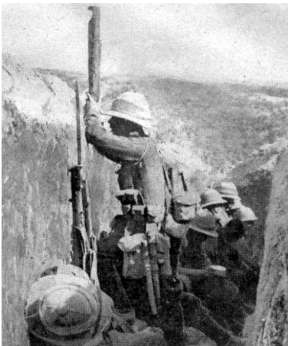
Skytte grav på Gallipoli, dog havde de ikke tid til at lave dem, så det blev ofte bare en jord grav.