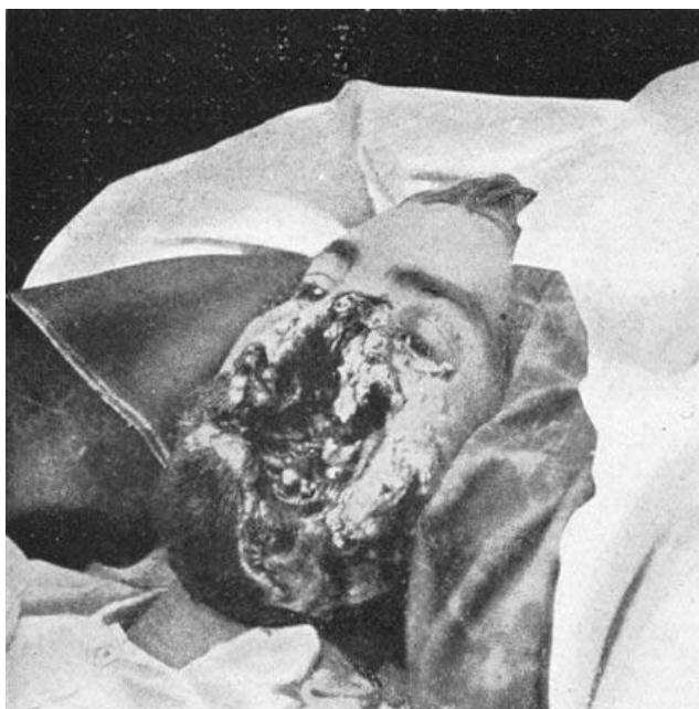
Denne mand er blevet lemlæstet i ansigtet.

Over ni millioner soldater mistede livet i første verdenskrig. Mange af de overlevende havde mistet både arme og ben eller fået andre alvorlige mén. Omkring 12 % af de sårede havde fået lemlæstet deres ansigter, og det var dem, der havde sværest ved at finde sig til rette i samfundet igen. Efter det soldaterne havde været vidne til, blev flere tusinde mentalt skadet. Mange soldater var også ofre for "Granatchok", og det var der mange forskellige reaktioner på. Nogle rystede over hele kroppen, mens andre var helt lammede. Nogle lo sågar hysterisk, eller havde tvangsforestillinger.