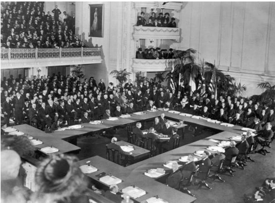
Åbning af konferencen i Versailles i januar 1919.

Den 18. januar 1919 i Paris skulle der afholdes en konference, hvor fredsbetingelserne skulle fastsættes. 27 lande deltog, men de styrende var den amerikanske præsident Wilson og franske præsident Clemenceau, den britiske premierminister Lloyd Georg og Italiens Vittorio Orlando. Tyskerne havde ikke noget at skulle have sagt. Wilson havde 14 punkter, som var grundlaget for forhandlingerne. Der var stor uenighed, specielt mellem den amerikanske præsident Wilson og den franske præsident Clemenceau, som var meget praktisk og hævngherrig. Til sidst blev der udfærdiget fem traktater. Den vigtigste traktat blev underskrevet af de allierede og tyskerne i Versailles-paladset. Tyrkiet og Østrig-Ungarn mistede en del af deres landområder, og tvang dermed Bulgarien til at give afkald på noget af deres land.