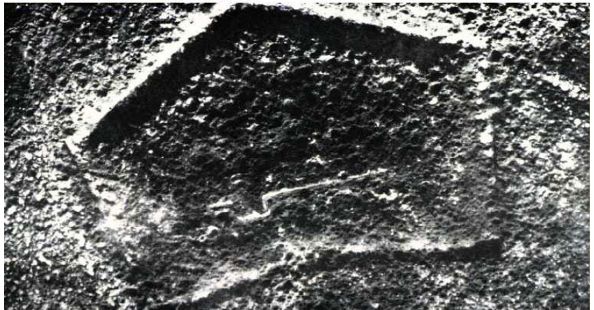
BELOW - Aerial view of Fort Douaumont in November 1916