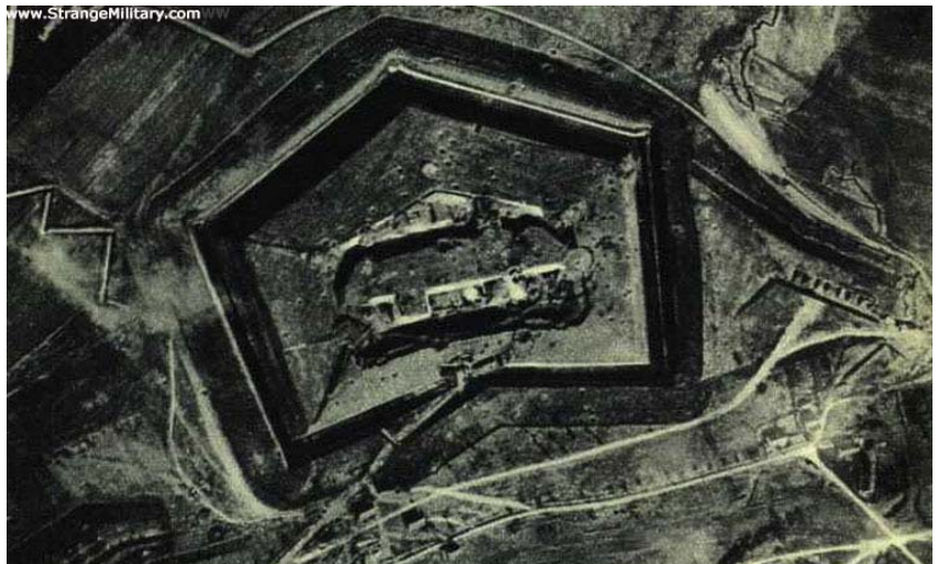
ABOVE - Fort Douaumont in 1915 before Battle of Verdun