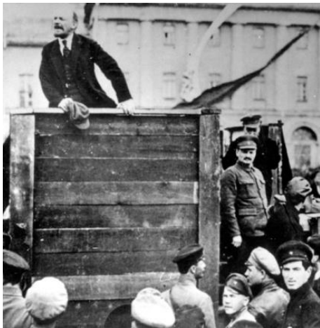
(Lenin taler til bolsjevikkerne. Lenin var en fremragende taler.)

Aftalen blev senere samme år annulleret. Alle disse ting betød at Tyskland kun skulle koncentrere sig om de vestlige lande, hvor de hovedsaglige lande deriblandt selvfølgelig var Frankrig og England. Det betød at iværksatte et sidste desperat forsøg på at vinde krigen på Vestfronten.