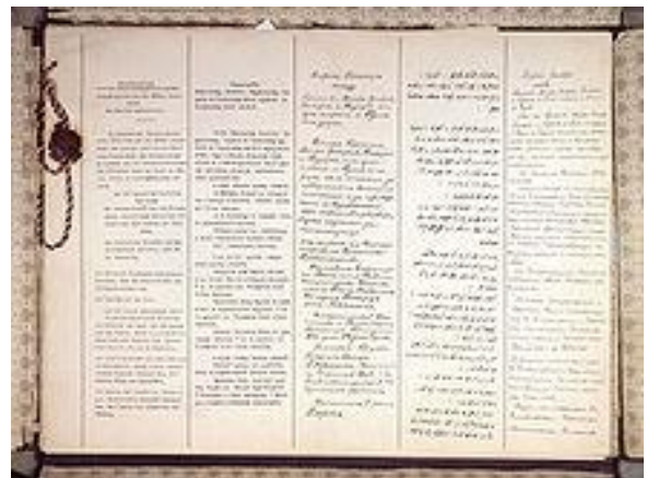
(De første to sider i fredstraktaten skrevet på fem forskellige sprog)