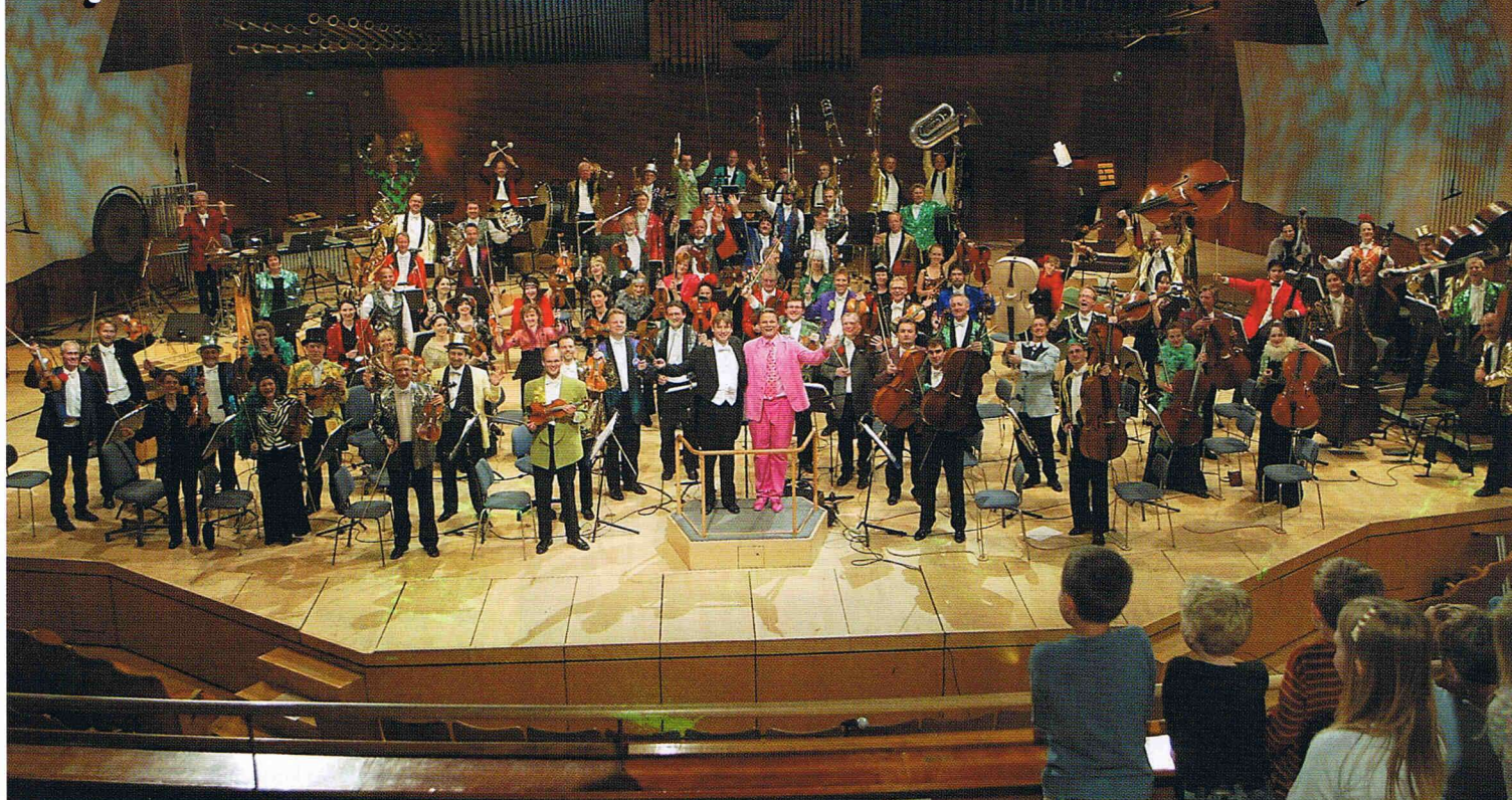
Sigurd Barret og Symfoniorkesteret blev startskud for symfoniorkestrernes "børnearbejde".

S igurd Barret, som alle børnefamilier vil kende fra DR's børneudsendelser, er ikke det eneste kort landets symfoniorkestre har at spille ud i kampen om at fange børnenes og de unges interesse. Tiltagene er mange, og succesen er ikke udeblevet.