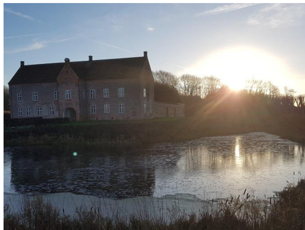
Is på slotssøen i den smukke vintersol