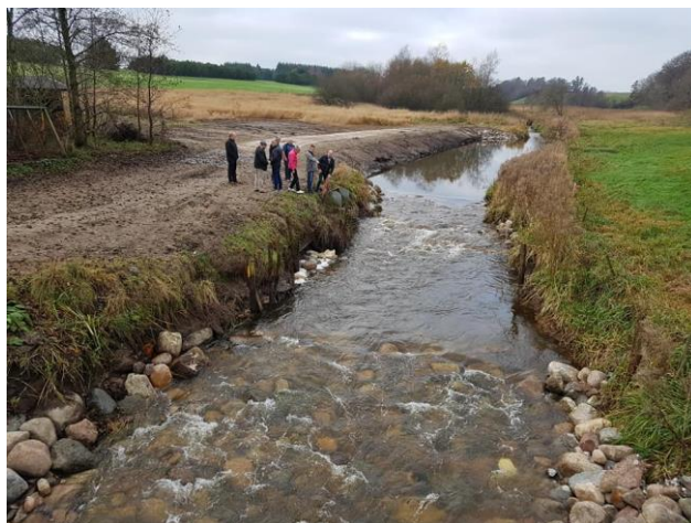
På gåtur til åen tættest på hul 1, hvor vi får udfordringer efter vandstanden er faldet ca. 1 meter.