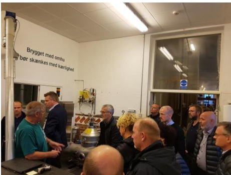
→ Rundvisning i tapperiet

Derfor er klubbens trofaste sponsor Carlsberg allerede nu sendt i tænkeboks til hvor vi skal have gruppen med hen i november 2019 når vi gentager succesen 😊