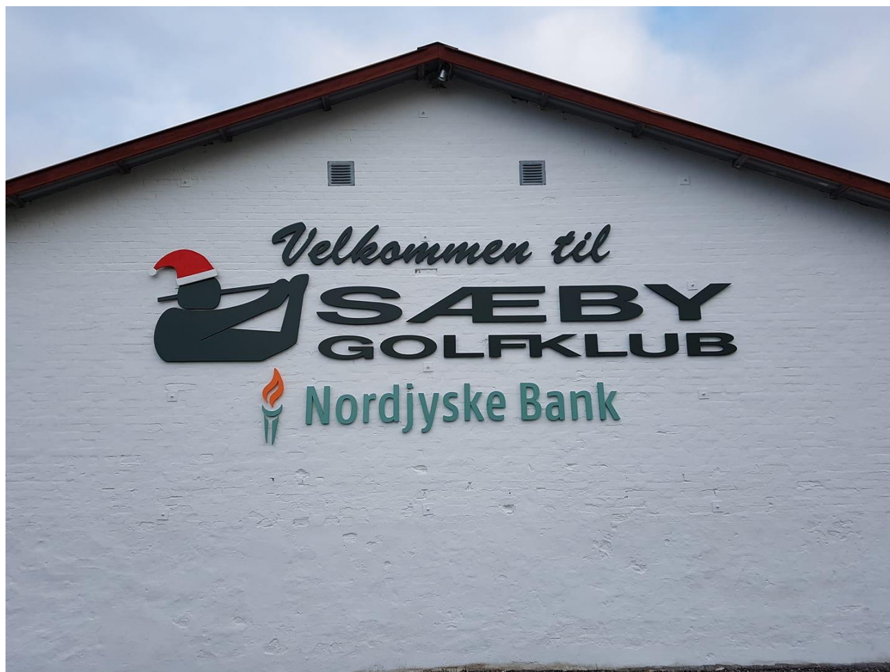
Julestemningen er i højsædet på vores flotte nye endegavlsskilt ☺