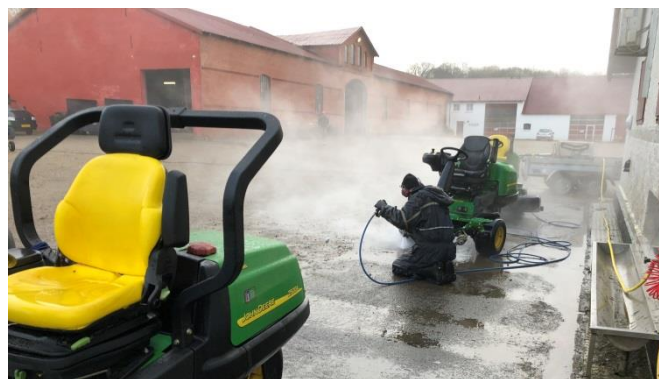
Vinterklargøring og service af maskinerne er én af opgaverne keeperne lige nu arbejder med.