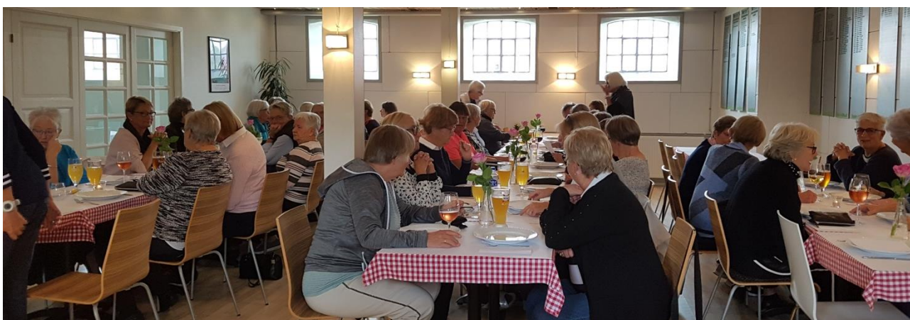
Fra afslutningen til slotssøstrenes generalforsamling 2. oktober

Check vores hjemmeside. Her finder du mange interessante informationer, billeder mv. og vær ikke bleg for at kontakte en af os.