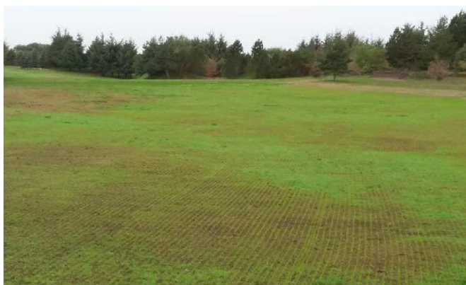
Det spirer godt på fairway 17 efter vi har eftersået