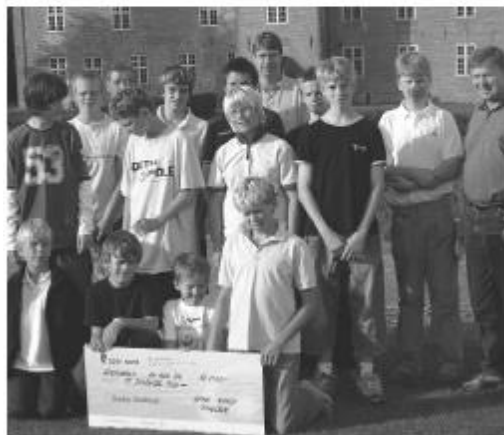
Der var flotte præmier til Amtsmesterskaberne