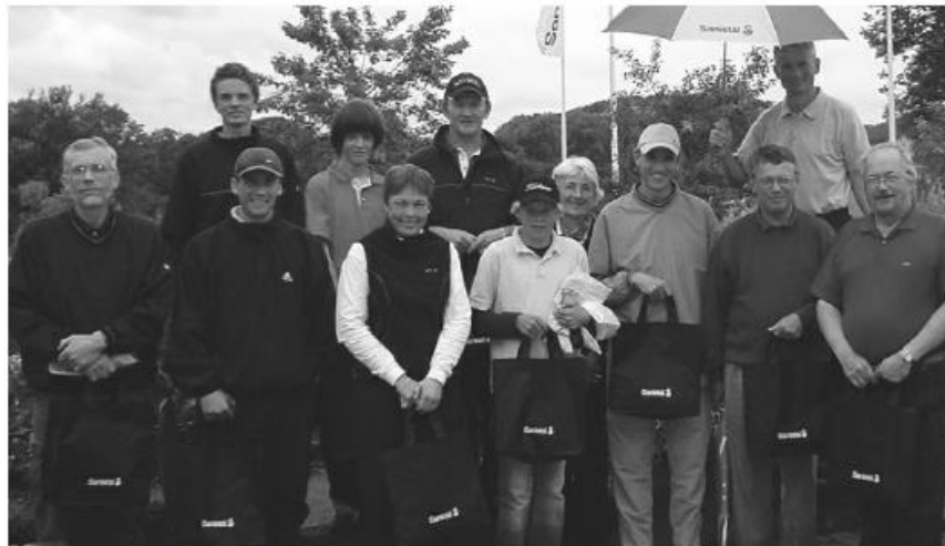
Vinderne samlet til fotografering.