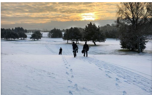
”Rigtig” vintergolf