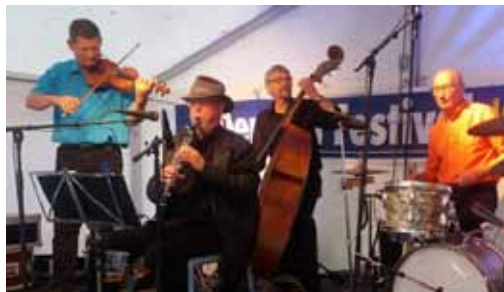
Fredag 21.00 • Duus Vinkælder

Bliv annoncør og støt Den Blå Festival Kontakt os via hjemmesiden, og hør om mulighederne