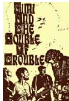
Fredag 23.00 • El Mariachi