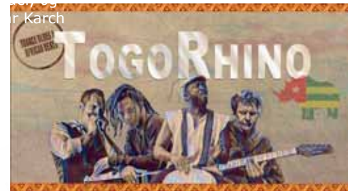
Fredag 23.00 • John Bull Pub