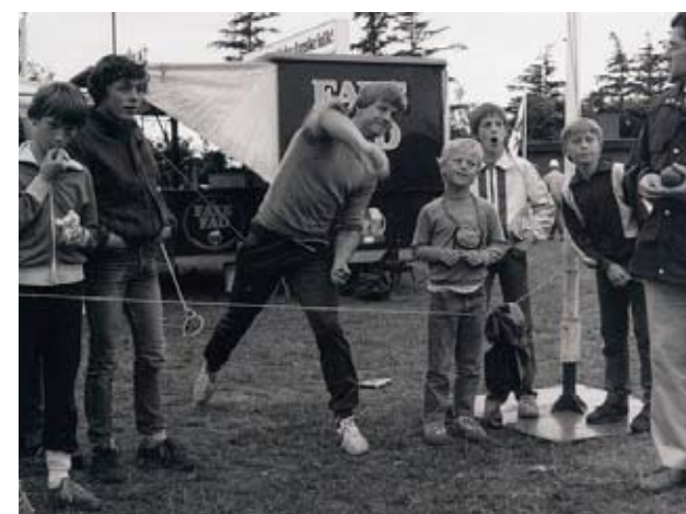
Historisk glimt fra "Fut i Felding"