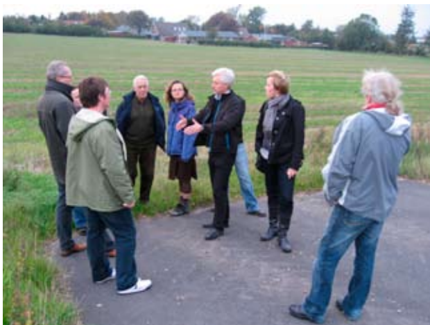
Byvandring i Nr. Felding d. 7 oktober 2008