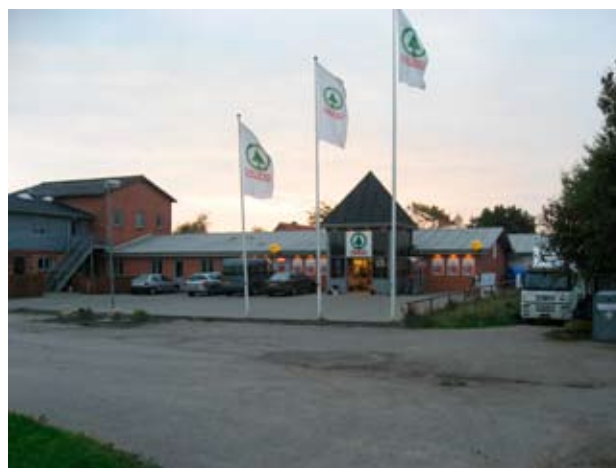
'Bypladsen' foran den nye købmandsforretning