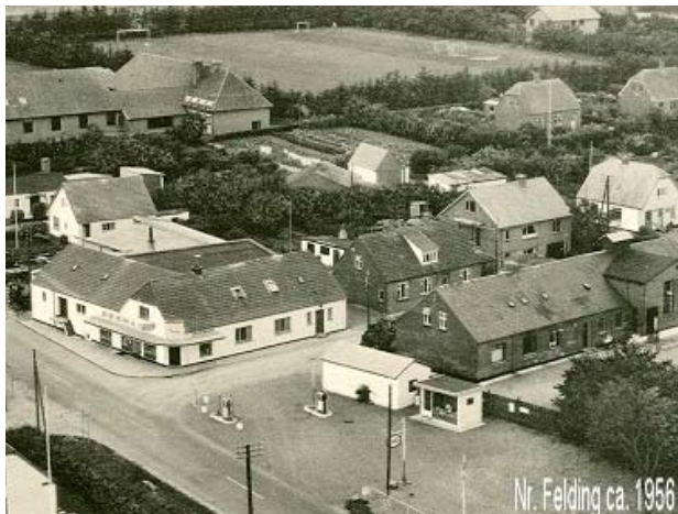
Nr. Felding midt i 1950erne med 'bytorvet' i forgrunden

I takt med byens udvikling gennem de sidste 30 år, har det været nødvendigt at skabe nye rammer til beboerne. Der er bygget multi-hal og børnehave. Skolen er blevet om- og udbygget. Købmandsbutikken er flyttet i store lokaler. Disse initiativer har sammen med en flydende takt i udstykningen af parcelhusgrunde skabt gode rammer også for de mange nye beboere i Nr. Felding.