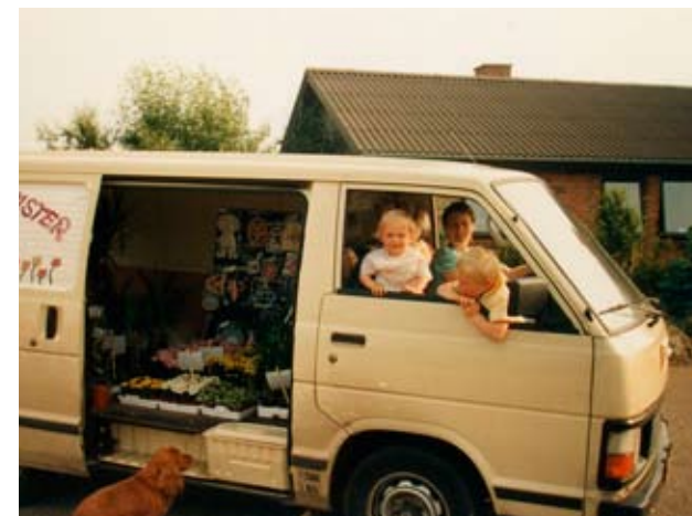
Yngler til "Fut i Felding"