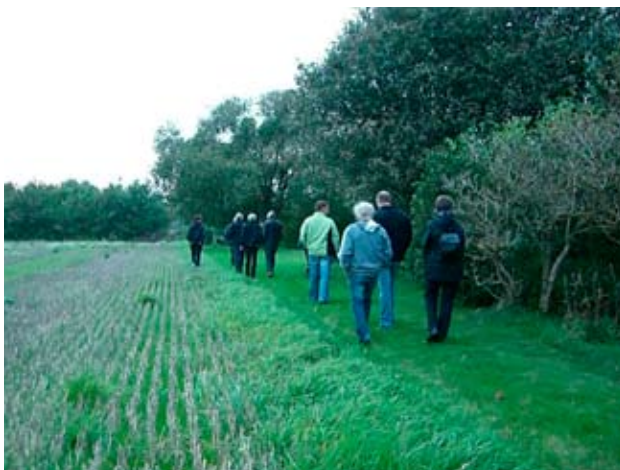
Byvandring i Nr. Felding d. 7 oktober 2008