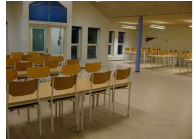
Fælles faciliteter i Idrætscenter Syd