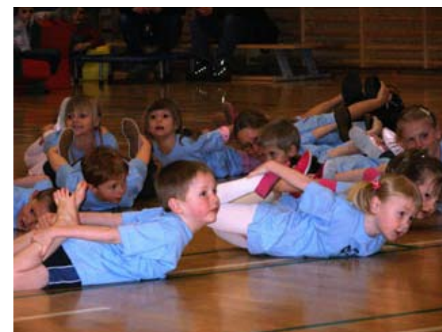
Gymnastik for de mindste