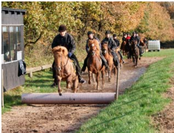
Den aktive islandshesteklub

Nybyggeriet i Nr. Felding har haft en positiv afsmidning på skolestruktets befolkningstal i de seneste 5 år. I 2003 var der således