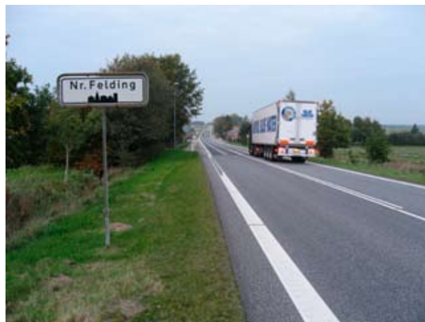
Ankomst til Nr. Felding fra syd ad Hovedvej 11

Alt dette er med til at skabe et meget dynamisk lokalsamfund.