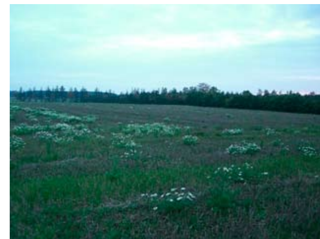
Potentielt udstykningsområde mod syd