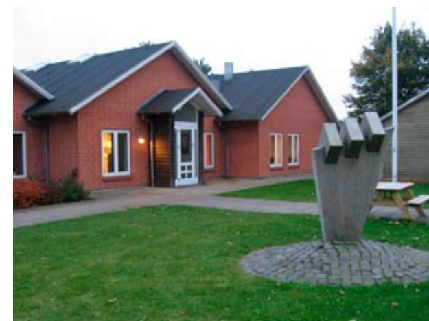
Den lokale daginstitution