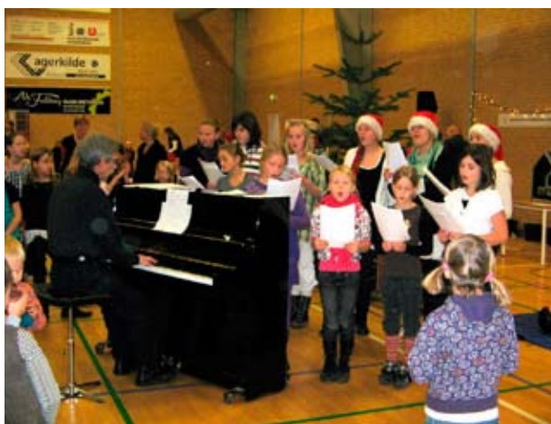
Julestemning i Idrætscenter Syd