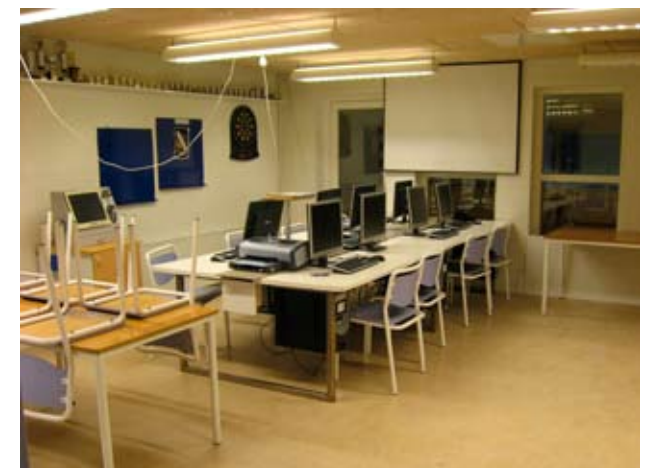
IT-foreningens faciliteter i Idrætscenter Syd