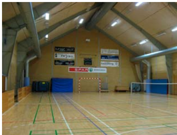
Sportshallen i Idrætscenter Syd