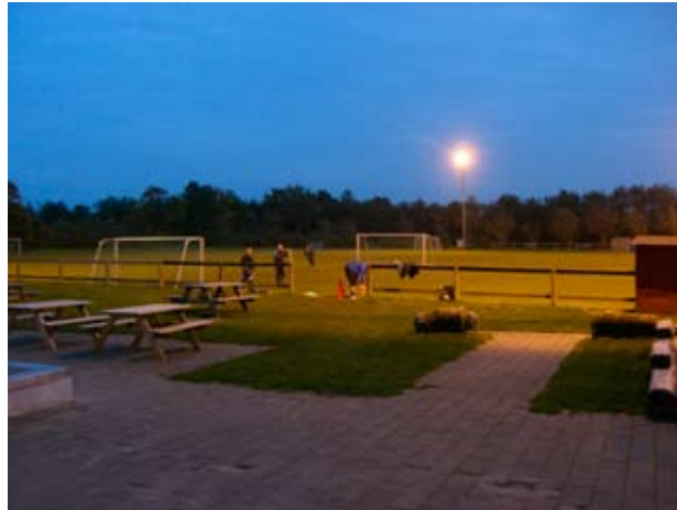
Boldbaner med mulighed for træning i kunstlys

Nr. Felding er Holstebro's ansigt mod syd.