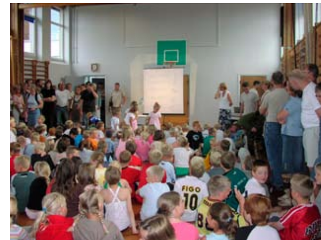
Samling i skolens gymnastiksal