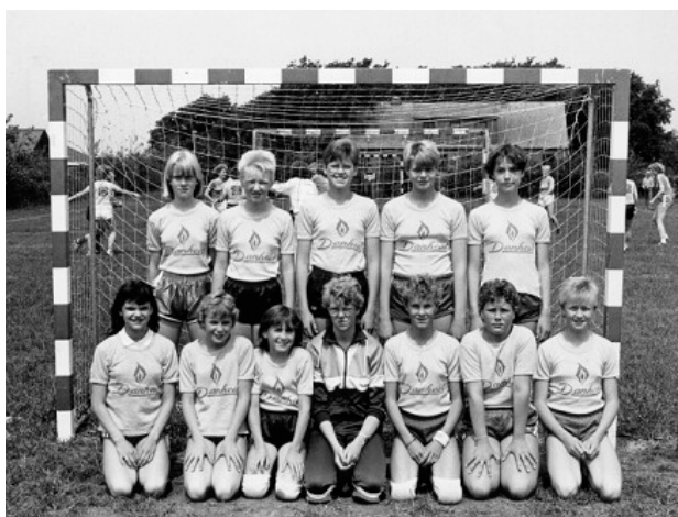
I Nr. Felding er der tradition for at være aktiv