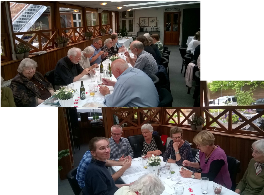
Fra 10 års jubilæet.