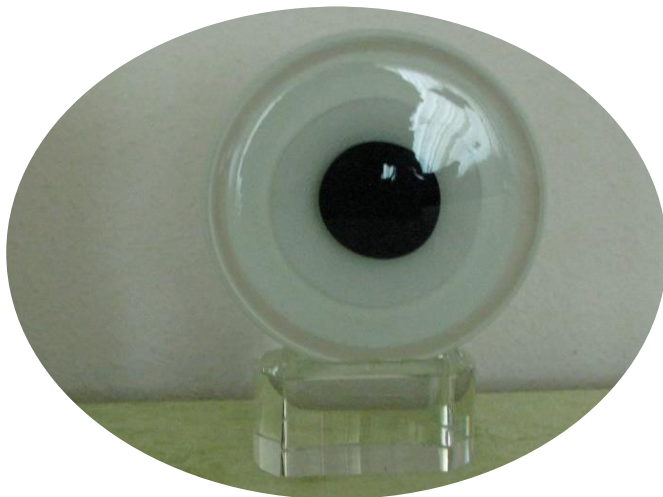
Årets Souvenir: Glasøjet

Uanset hvad, så er det rart at komme hjem efter 3 dages udlændighed og se, at alt er ved det gamle!