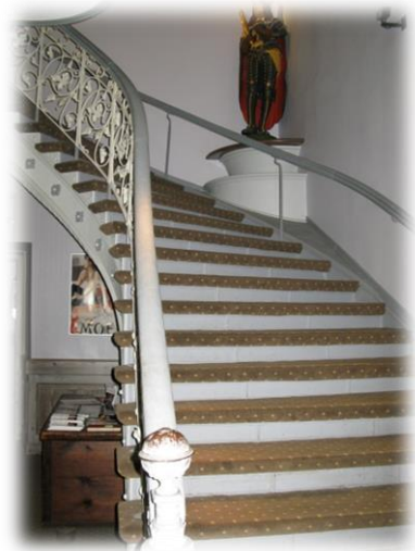
Den statelige trappe

Så er vi her – nu må det briste eller bære med hensyn til sproget. Mit skole-tysk er unægtelig rustet siden sidst. De gloser jeg er stærk i kan begrænses til disse: