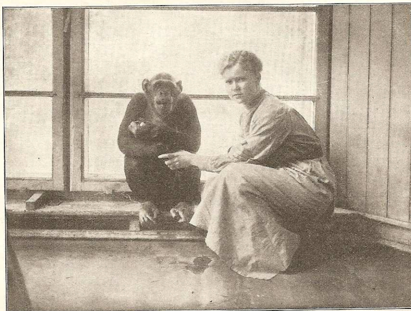
Fig. 7. Chimpansen Grethe med sin Selskabsdame.

meget overdrevet i, hvad der i saa Henseende berettes, det har vi rig Lejlighed til at se her ved Slangefodringen. Man maa fodre baade Giftslanger og de store Kvælerslanger med levende Dyr, de sidste dog kun delvis, idet de æder dræbte Dyr, naar de først har faaet Lov til selv at kvæle et eller to levende. Man sætter altsaa levende Dyr, som Regel Kaniner, Marsvin eller Rotter, nu og da dog ogsaa en Høne eller en Due ind til Slangerne, og disse Dyr viser absolut ikke Spor af Forstaaelse af deres farlige Situation eller