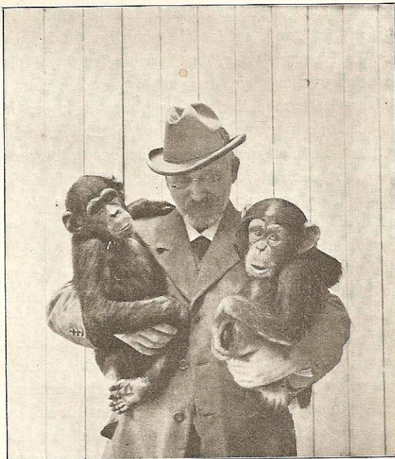
Fig. 7. De unge Chimpanser, Mathis og Gissemand.

Det er en let Sag at blive Ven med et Dyr, næsten et hvilket-somhelst Dyr, det kommer blot an paa at vise det usvigelig Venlighed, at have Taalmodighed og aldrig være nervøs eller ængstelig. Drillen et Dyr maa man selvfølgelig aldrig, naar man vil vinde dets Tillid, blive nervøs, naar f. Eks. en Tiger eller en Løve kaster sig rasende frem imod en, maa man heller ikke; thi ser Dyret, at man