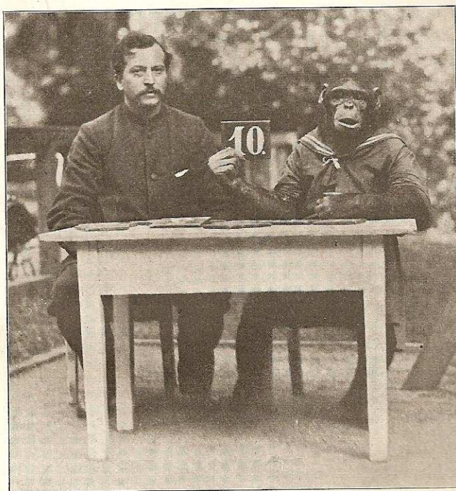
Fig. 6. Basso med sin Læremester.

stillede sig ganske til Hr. Marbes Raadighed. Det var denne klart, ligesom det var mig, at Aben læste Svarene ud af Lærerens Ansigt, men det var ham længe ikke muligt at finde, at denne gjorde det allermindeste Tegn til Aben. Saa faldt der ham en Tanke ind, idet han syntes at se en minimal Stillingsforandring hos Læreren, naar han stillede sine Spørgsmaal, og sé, det viste sig virkelig, at denne, sig selv ganske uvidende, indstillede sit Ansigts Medianplan paa den Plade,