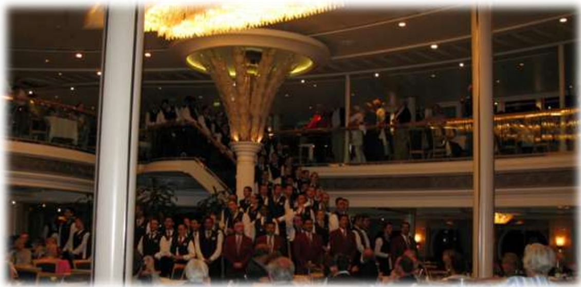
Italiensk sang udført af 50 nationaliteter – blot ikke en eneste fra Italien!

Vi fik 3 retter – den ene dag Italiensk inspireret, så Russisk, Ungarsk og Spansk. Det sidste land husker jeg ikke, måske fordi al mad var tilberedt som Amerikanerne mener det skal. Det forvirrer lidt, f. eks. fik vi kartoffelmos til mange af retterne – og ris til Ungarsk Gullash! Men – dette skal ikke opfattes som kritik – alt var lækkert og velsmagende, og der kunne til min store fryd vælges suppe hver dag som forrret.