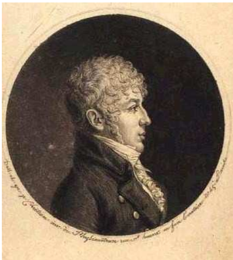
Dette billede findes i Det Kgl. Biblioteks samlinger.