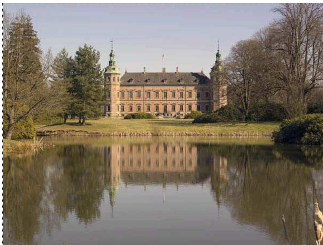
Frijsenborg ved Århus