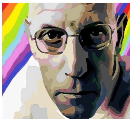
Michel Foucault (1926-1984). Fransk filosof og idéhistoriker, som med sine studier af seksualitetens historie formulerede, hvad man tilnærmelsesvist fristes til at kalde den mandlige homoseksualitetsforsknings uomtvistelige mantra: " Le sodomite était un relaps, l'homosexuel est maintenant une espèce " (Foucault, 1976: 59; Egen oversættelse: "Sodomitten havde været en afvigelse, den homoseksuelle blev fra nu (af) en art".

afviste hverken forbud eller maskering af kønnet, men advokerede derimod, at ideen om