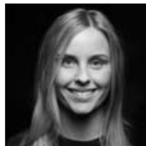
NINNA ILLUM Nr. 3 til VM i Disco