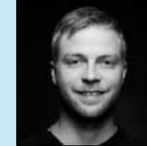
BASSE STEPPAT Administration & Reception Driftsdirektør