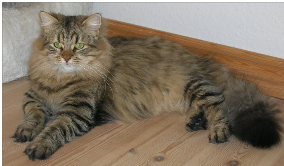
DK* Meldgaards Cha Cha

være med hvor tingene sker, derfor er den helt af sig selv en del af alt i hjemmet. Mange Sibirske elsker at lege selvom de er ovre killingestadiet.