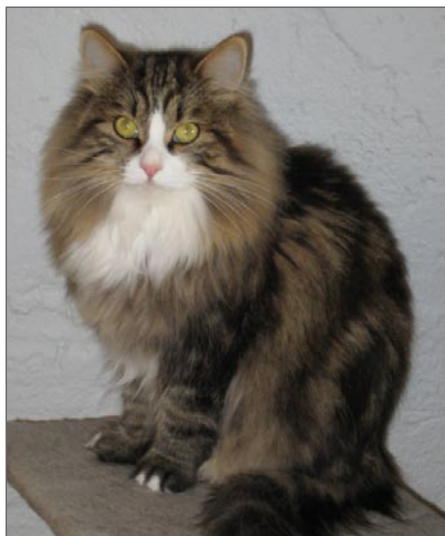
DK* Meldgaards Reshetko

Det er ikke ønskeligt, at den Sibiriske kat har tufser (hårtotter) på spidsen af ørerne. I stedet har den tufser rundt om