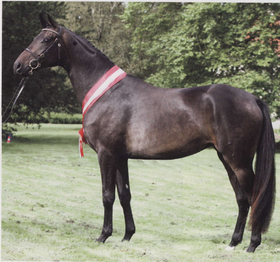
■ Romera K - en af de smukkeste 2-års hopper man har set på Eliteskuet.

markeret sadelleje og en særdeles god travbevægelse. Hoppens mor, Secret Dream xx DH 5938, er selv blevet fejret på Eliteskuet, da den i sin tid blev udråbt som modelhoppe i halvblodsavlen. Selvsamme fuldblodshoppe Secret Dream xx er mor til avlshingsten Baccarat xx e. Federico xx, også opdrættet af Tea Jensen, Svenstrup J og nu ejet af familien Worre-Jensen, Køge.