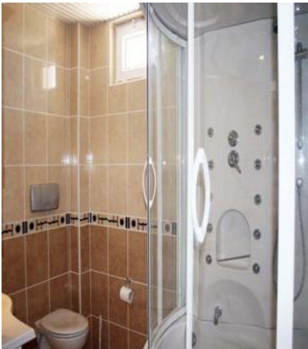
Et af i alt 3 badværelser i lejligheden.