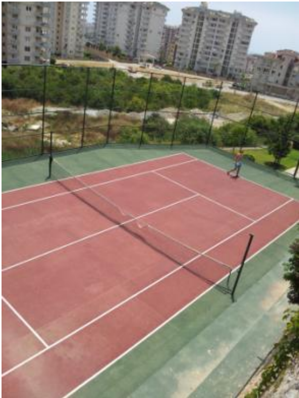
Tennis/boldbanen på Utopia