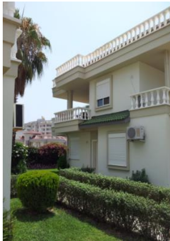
Penthousen på Utopia set udefra