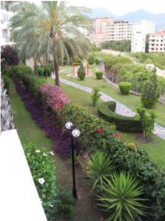
"Baghaven" set fra penthousen på Utopia.