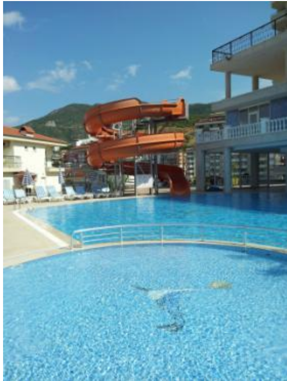
Swimmingpoolen med rutsjebane på Utopia