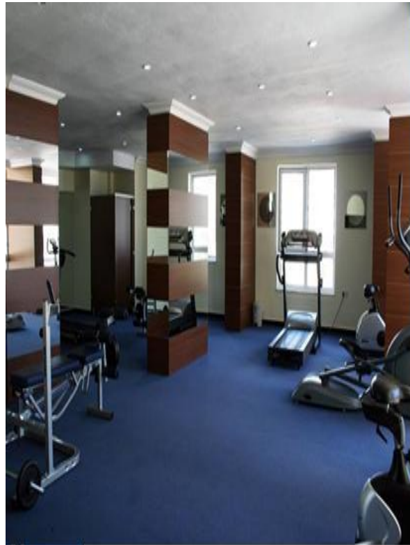
Fitnesscenteret på Utopia