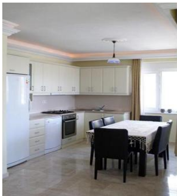
Køkken i penthouselejligheden.