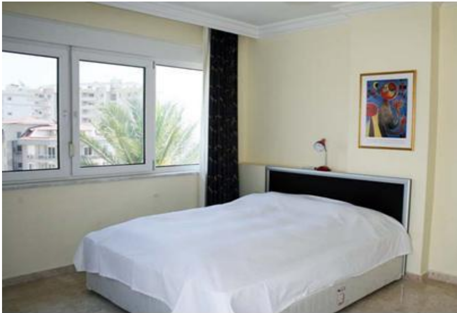
Et af 3 soveværelser i penthouselejligheden på Utopia