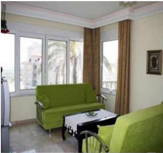
Del af opholdsstuen i penthousen på Utopia.