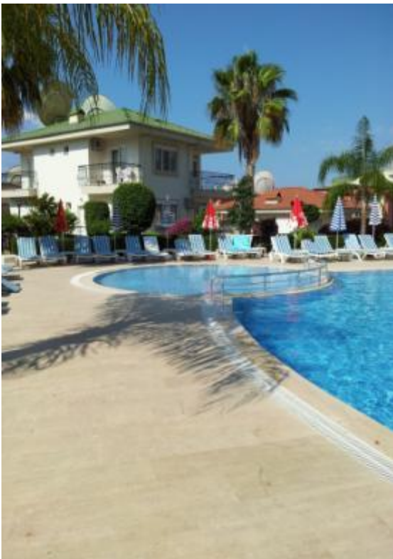
Børnepool området på Utopia