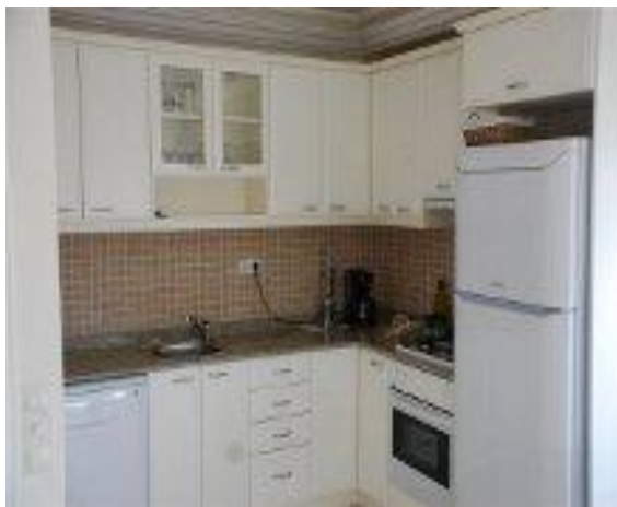
Køkken i villa lejligheden