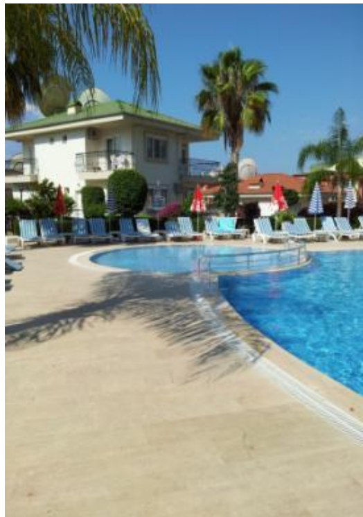
Poolområdet med børnepool og solsenge.