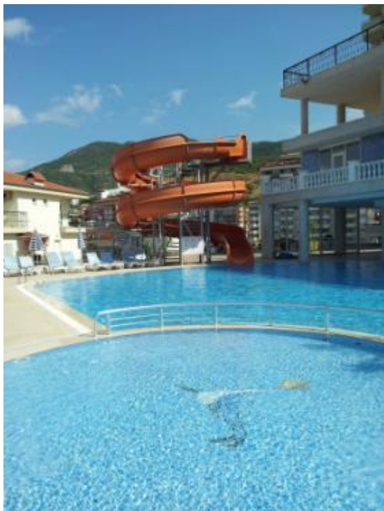
Swimmingpool med rutsjebanen.