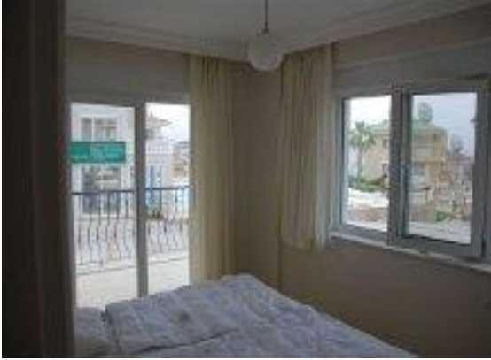
Soveværelse i villa lejligheden.