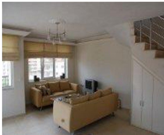
Opholdsstuen i villa lejligheden