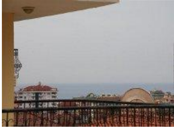
Udsigt fra villa lejligheden.