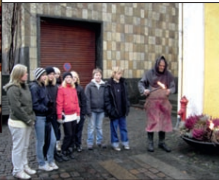
Konfirmander fra Sundby og Tødsø var sammen med "bøden" tilbage i middelalderens Ålborg