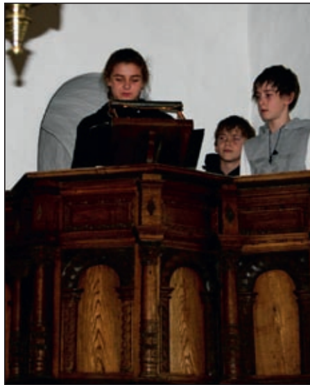
Konfirmandernes gudstjeneste 2008

Årets konfirmander vil i selskab med præsten stå for denne gudstjeneste. Alle, særligt forældre og bedsteforældre, inviteres til denne gudstjeneste. Efter gudstjenesten vil der være en forfriskning i kirken.