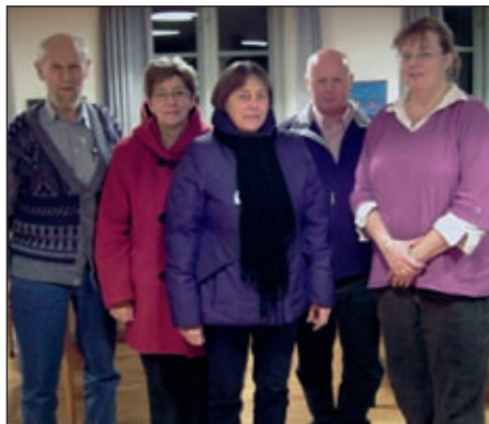
Det nye menighedsråd i Flade:

Jeg valgte at sige ja til at komme i Sundby Menighedsråd af flere grunde. Jeg mener, at man er nødt til at bakke om det lokale, når man bor i en lille by som Sundby. Vi vil gerne have en kirke til forskellige aktiviteter, men hvis der forsat skal ske forskellige ting i kirken, er det nødvendig med opbakningen. En anden grund er, at vi, efter min mening, er heldige at vi har en ung præst, som er modtagelig for nye ideer og nye tiltag. Det er et nyt menighedsråd, som står overfor nogle store opgaver. Noget skal gøres færdig, andet skal vi først til at begynde på, men det er spændende, og heldigvis er det en god flok, der tilsammen udgør Sundby Menighedsråd.