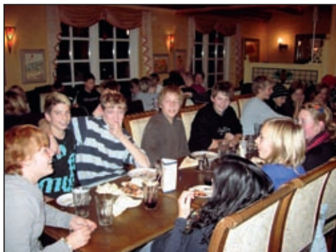
Konfirmanderne på Casa Blanca. Vi var afsted sammen med konfirmanderne i Tødsø, Alsted, Sdr. Dråby, Solbjerg, Skallerup og Dragstrup

Vi sluttede dagen med at spise sammen. Det var en ordentlig flok, Restarant Casa Blanca skulle have mad parat til. Og efter en lang dag med masser af snak og samvær drog vi hjem til vores 9 sogne på Mors.