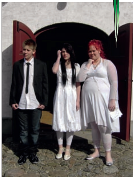
Sidste års konfirmander i Bjergby

Befrielsesgudstjeneste og -arrangement 4. maj kl. 19:00 i Flade Kirke og Konfirmandstuen