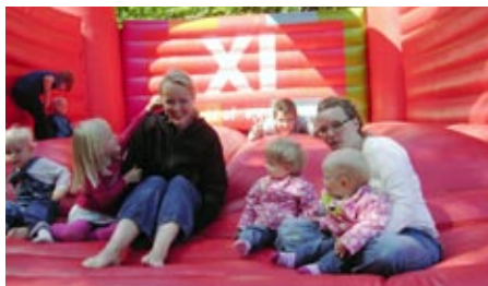
Det var en dag for både store og små