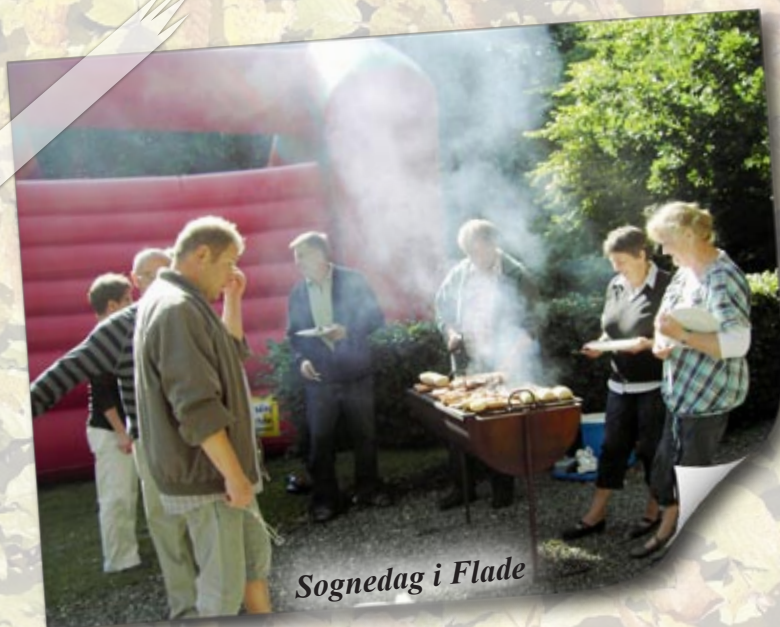
Sognedag i Flade