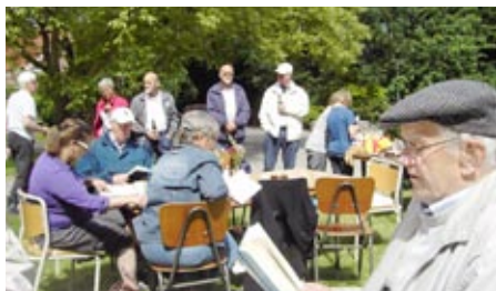
Der blev både sunget og snakket