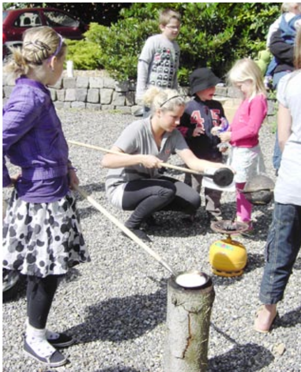
Det blev til masser af pandekager og popcorn