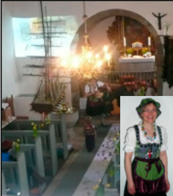
Tante Andante opfører Jesuopstandelse med børn fra pastoratets sogne!