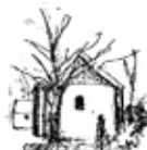
Sundby kirke Skolebakken 69, Sundby 7950 Erslev