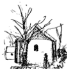
Sundby kirke Skolebakken 69, Sundby 7950 Erslev