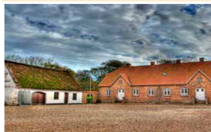
Kaj Munks Præstegård