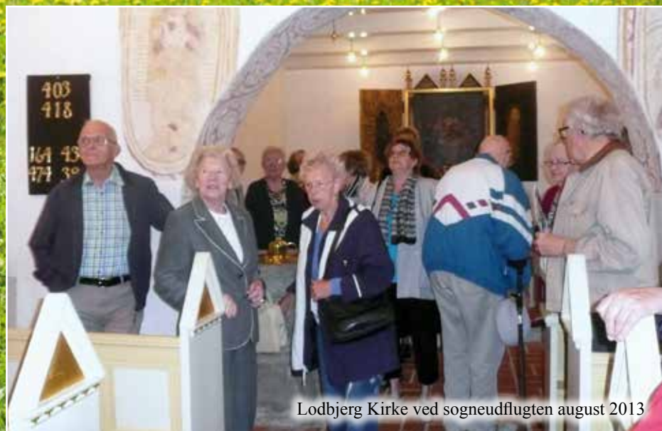
Lodbjerg Kirke ved sogneudflugten august 2013