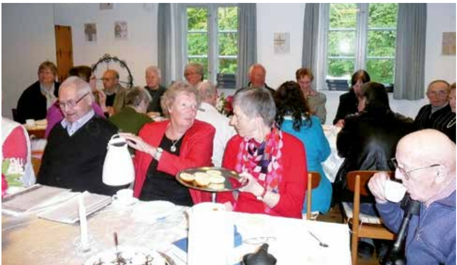
Fællessang og kaffe i konfirmandstuen ved Befrielsesgudstjenesten d. 4. maj 2014