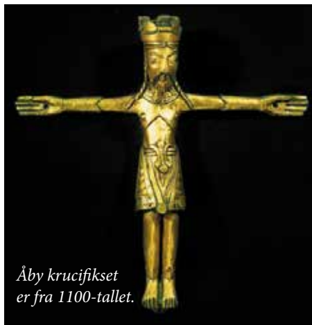
Åby krucifikset er fra 1100-tallet.

Og så har han indstiftet den nadver, som vi fejrer søndag efter søndag. Bagefter har han talt til dem – forklaret dem, hvad der er sket og hvad der skal ske – og nu er det så, at han taler til sin himmelske Far. ”Herliggør din Søn”, siger han, og vi ved, selvom det er svært at forstå, at det, han taler om som en herliggørelse, er den grusomme død på korset Langfredag og sammen med den opstandelsen Påskemorgen.