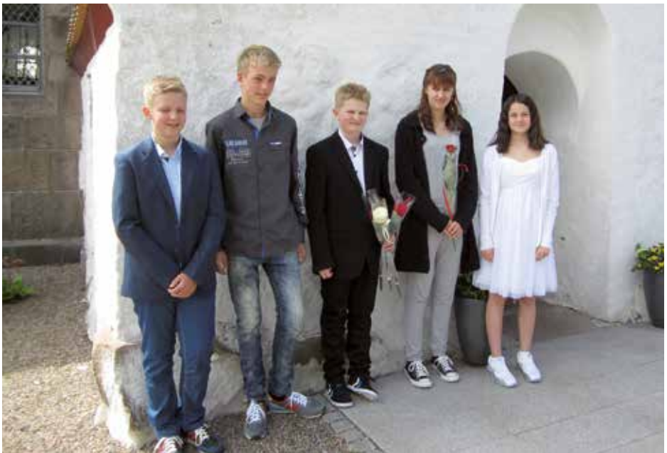
Konfirmanderne fra Flade.