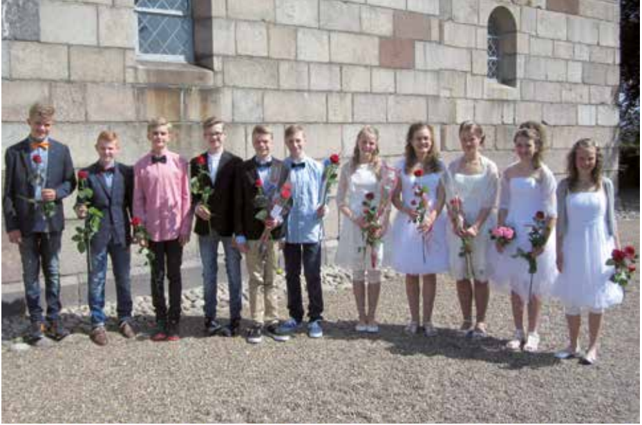
Konfirmanderne fra Sundby.