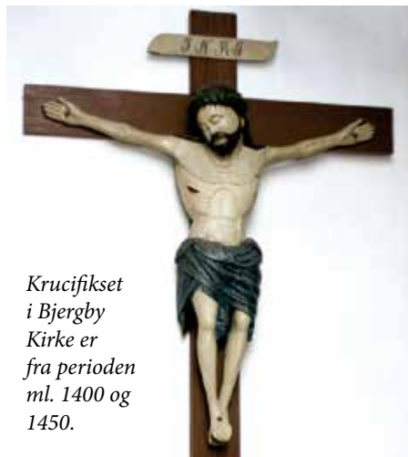
Krucifikset i Bjergby Kirke er fra perioden ml. 1400 og 1450.